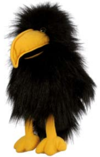
Kleine Raaf, pluche handpop Formaat 30 cm ISBN 978 90 5116 168 7 Prijs ca. 16,95

Ga zo alle kinderen langs en laat ze kort iets over zichzelf vertellen.